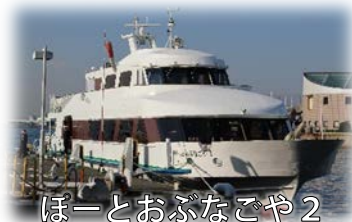
ぽーとおぶなごや2