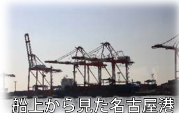
船上から見た名古屋港